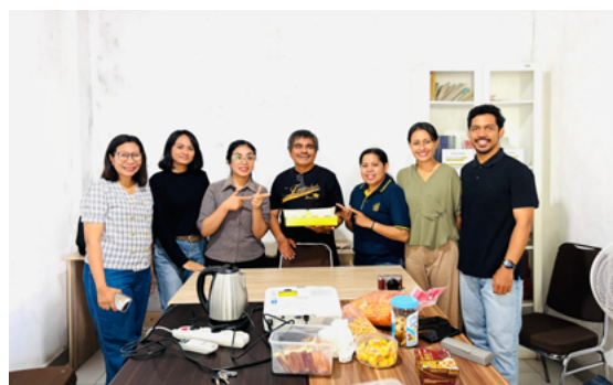
Foto rapat koordinasi staf Perkantas Kupang