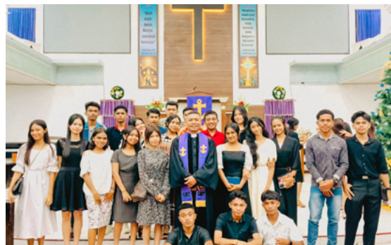
Foto Natal Perkantas Atambua