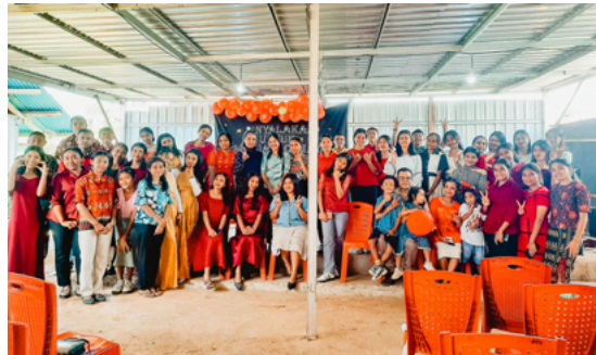
Foto Natal PMK Institut Pendidikan Soe