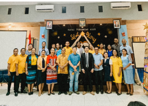
Foto Natal Perkantas Alor