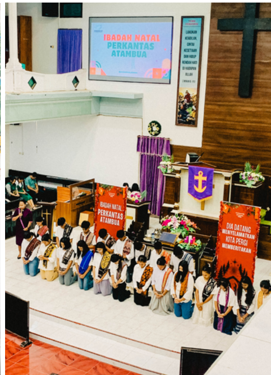
Foto Natal Perkantas Atambua sekaligus regenerasi pengurus Persisten