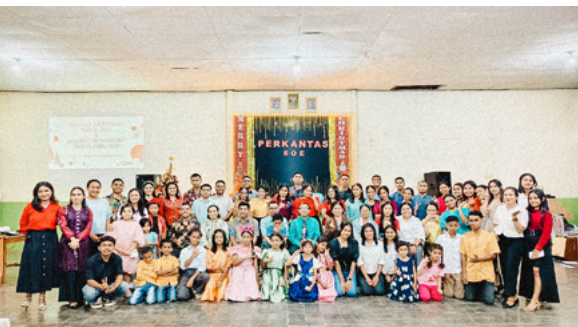
Foto Natal Perkantas Soe