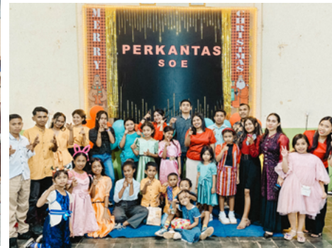
Foto Natal Perkantas Soe