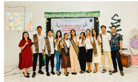
Foto regenerasi pengurus PMK Universitas Nusa Nipa Maumere