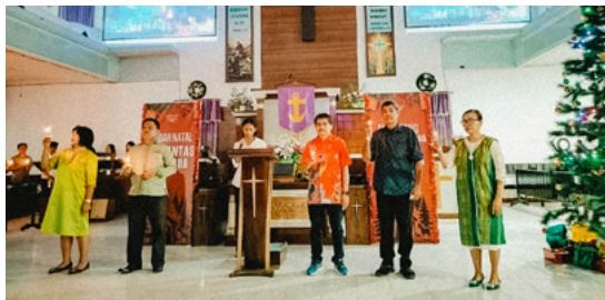
Foto Natal Perkantas Atambua