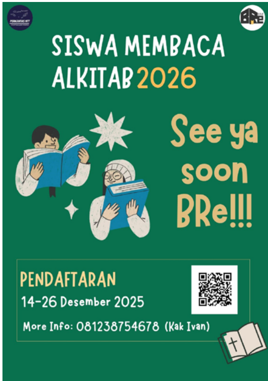
Foto flyer pendaftaran Siswa Membaca Alkitab