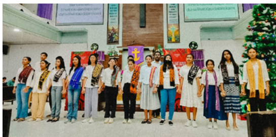
Foto regenerasi pengurus Persisten Kota dan Persisten SMA Kristen Atambua