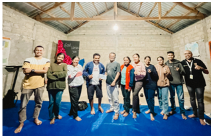
Foto rapat koordinasi komponen pelayanan Perkantas Kefa