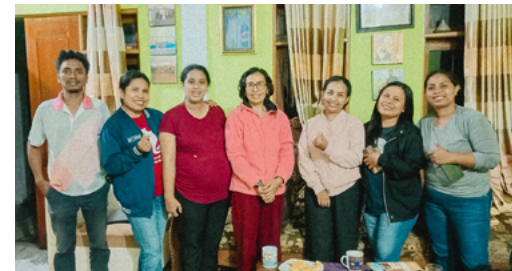
Foto rapat koordinasi komponen pelayanan Perkantas Waibakul