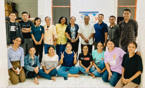
Foto Raker Hari ke-2 Perkantas Alor