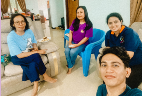
Foto ibadah siswa kota Waibakul