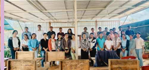
Foto Raker mahasiswa Kupang