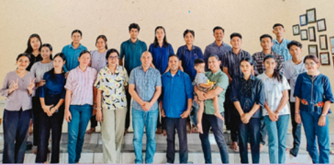
Foto Raker Perkantas Waibakul