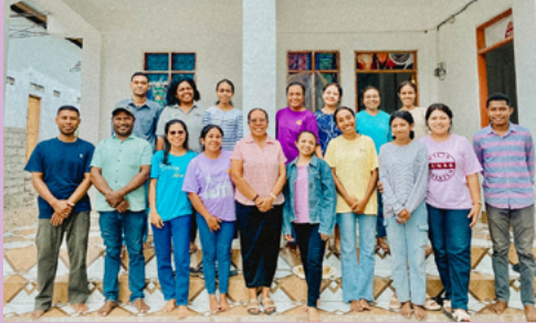
Foto Raker Perkantas Waingapu