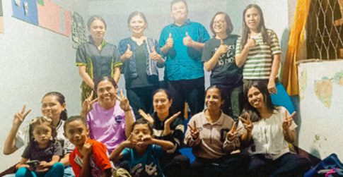
Foto ibadah siswa Perkantas Soe