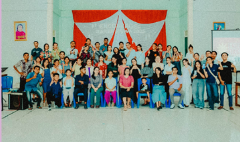
Foto weekend alumni Kupang