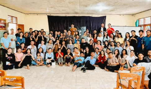
Foto Raker siswa Kupang