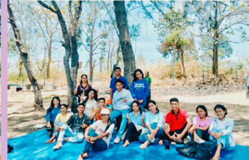
Foto ibadah alumni Perkantas Soe