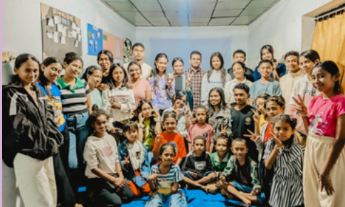
Foto ibadah mahasiswa Perkantas Soe