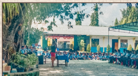
Foto pelayanan KATA di Alor