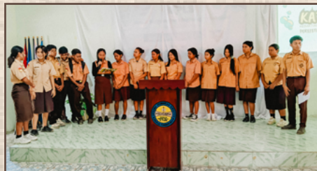
Foto pelayanan KATA di Atambua