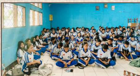
Foto pelayanan KATA di Alor