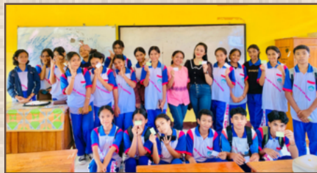
Foto pelayanan KATA di Kefa