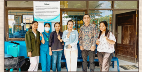
Foto pelayanan KATA di Waikabubak