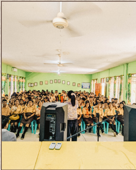
Foto pelayanan KATA di Waingapu