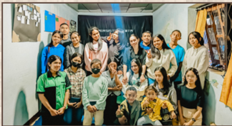
Foto pelayanan KATA di Soe