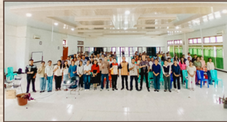
Foto pelayanan KATA di Waikabubak