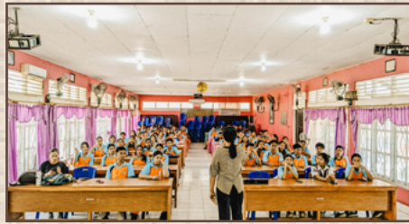
Foto pelayanan KATA di Waingapu