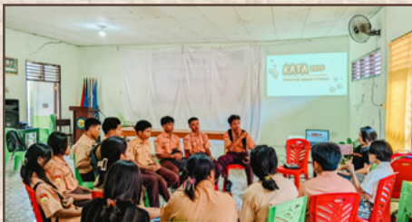
Foto pelayanan KATA di Atambua