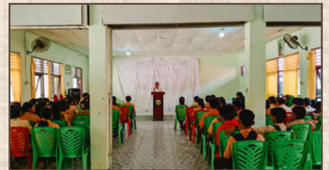
Foto pelayanan KATA di Atambua